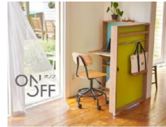
＜図3＞商品化されたワークデスク