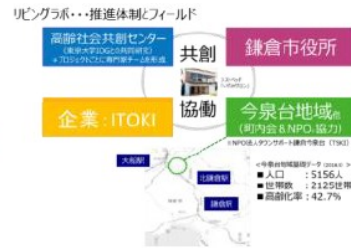
＜図2＞リビングラボ推進体制